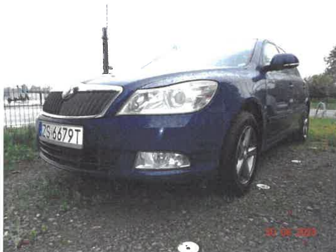
Widok ogólny samochodu