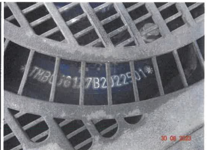
Numer nadwozia VIN