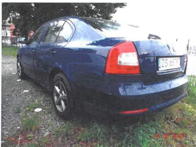
Widok ogólny samochodu