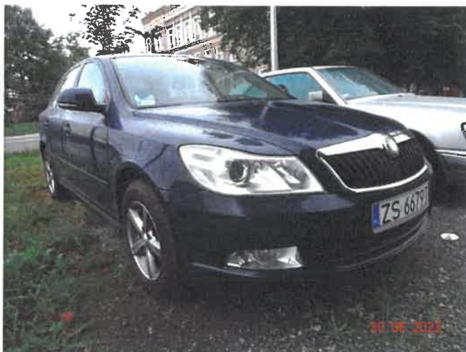
Widok ogólny samochodu