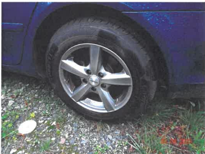
Stan kół i ogumienia