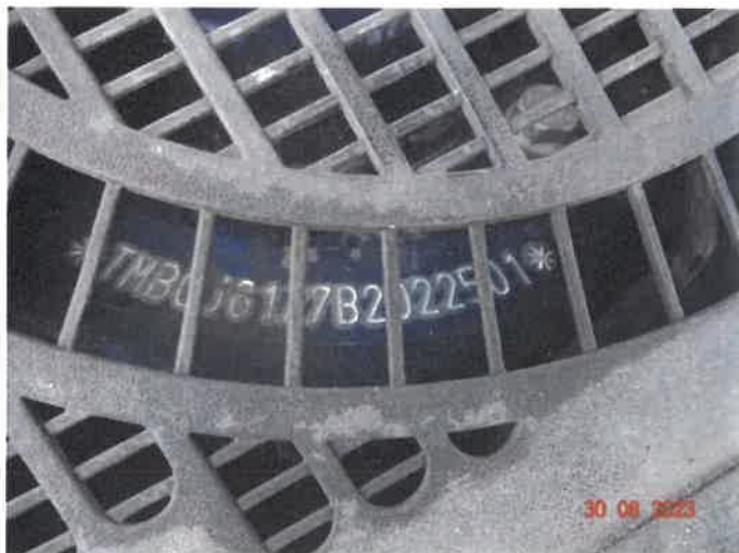
Numer nadwozia VIN