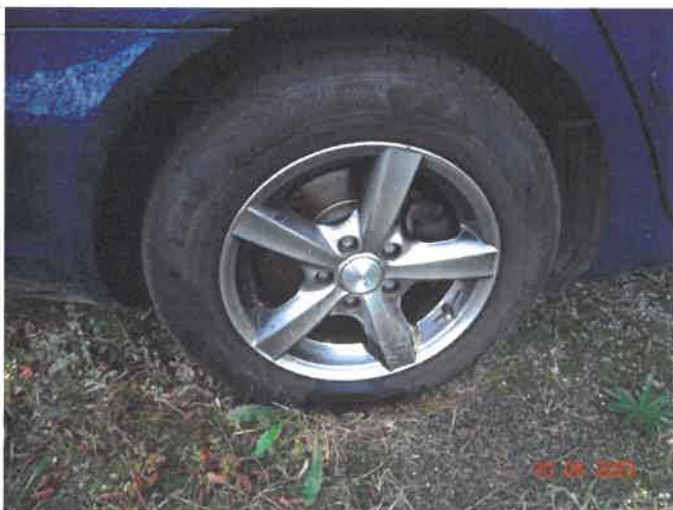
Stan kół i ogumienia