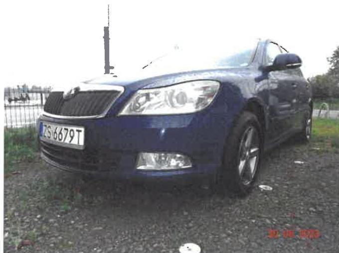
Widok ogólny samochodu