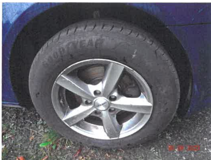
Stan kół i ogumienia