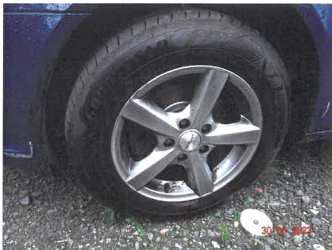
Stan kół i ogumienia