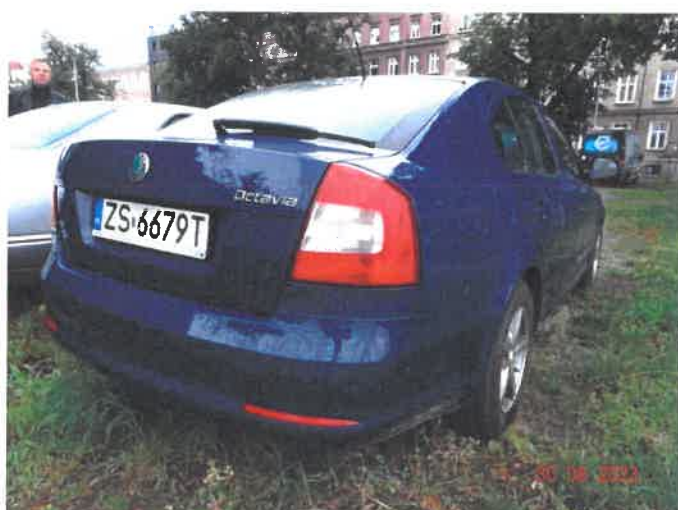
Widok ogólny samochodu