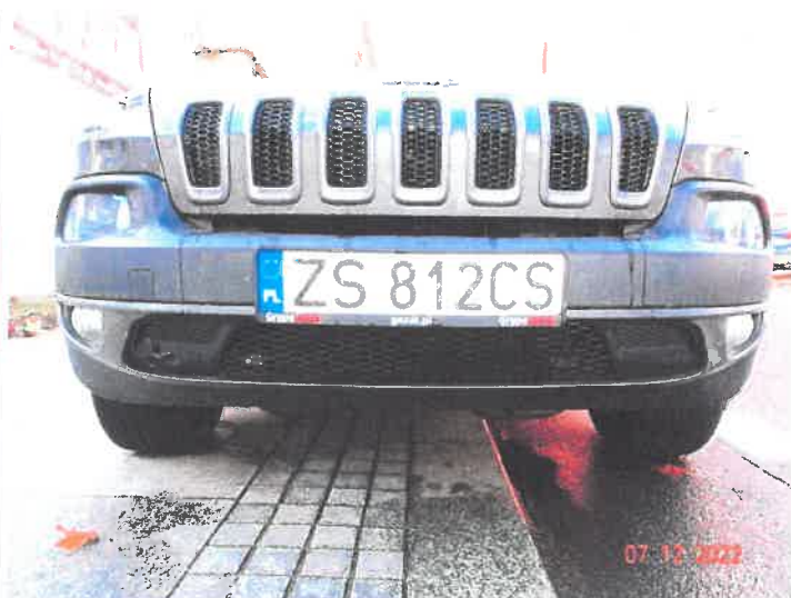
Widoczne uszkodzenia samochodu