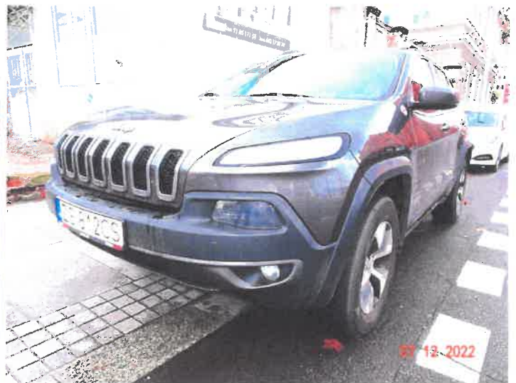
Widok ogólny samochodu