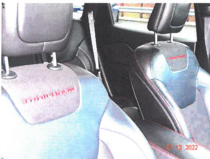
Widok wnętrza samochodu