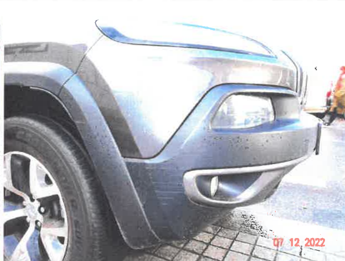
Widoczne uszkodzenia samochodu