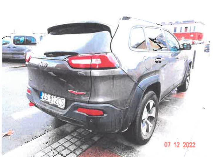
Widok ogólny samochodu