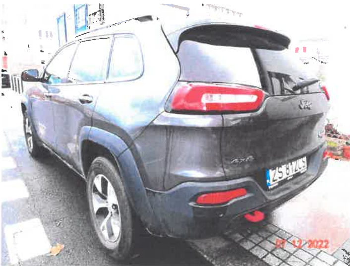
Widok ogólny samochodu