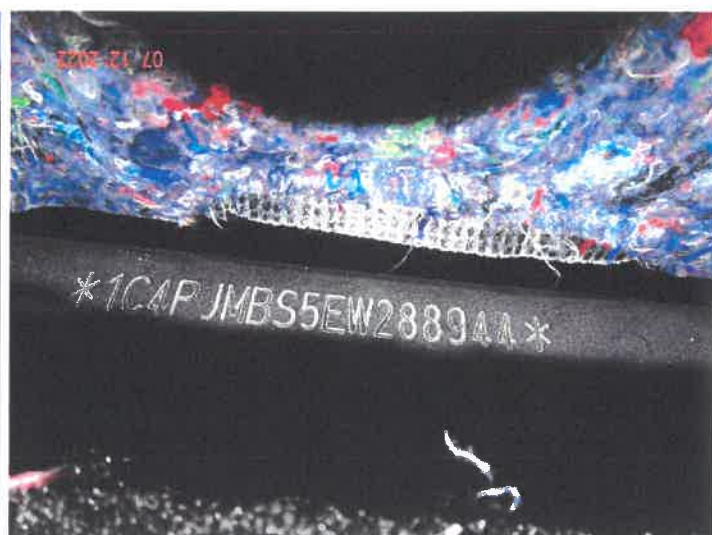
Numer nadwozia VIN