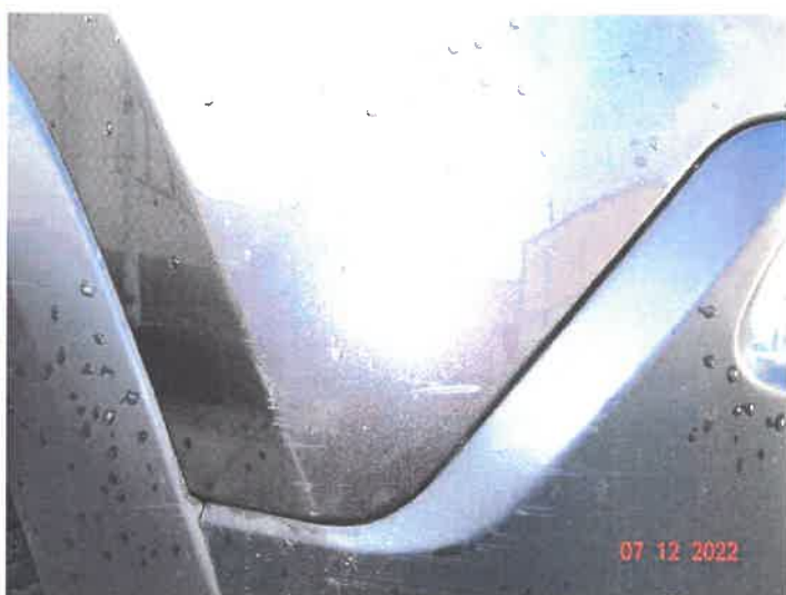
Widoczne uszkodzenia samochodu