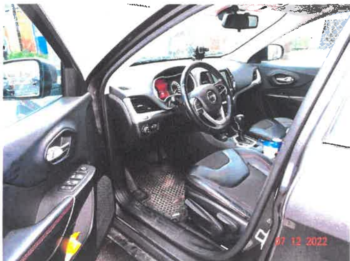
Widok wnętrza samochodu