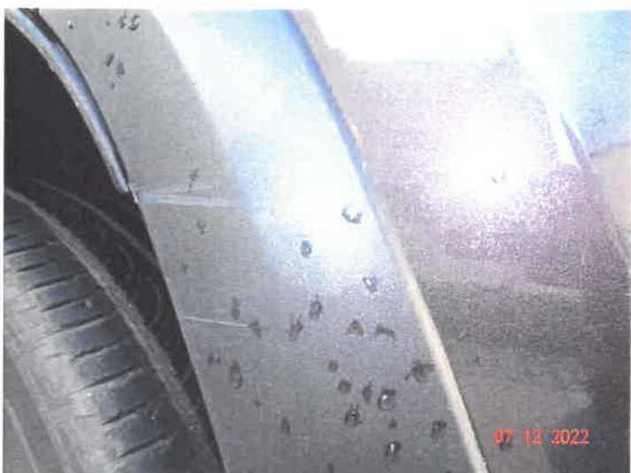
Widoczne uszkodzenia samochodu