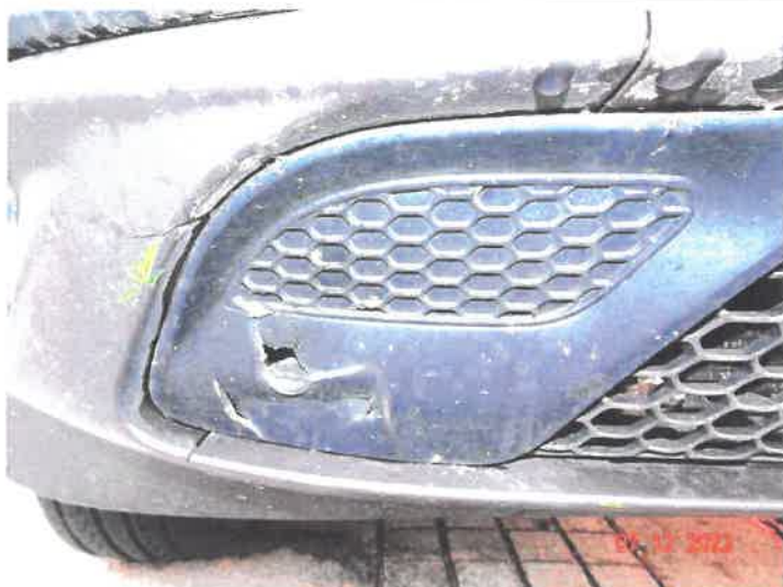
Widoczne uszkodzenia samochodu