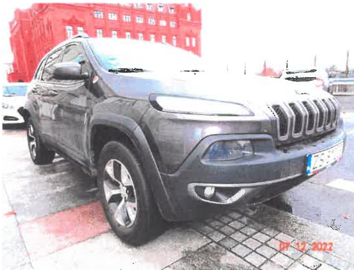
Widok ogólny samochodu