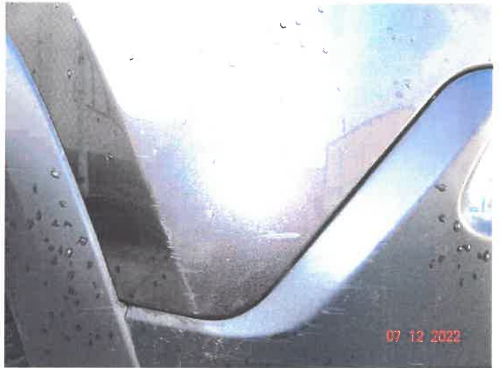
Widoczne uszkodzenia samochodu