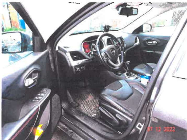
Widok wnętrza samochodu