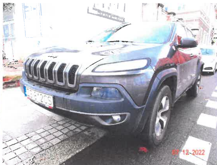
Widok ogólny samochodu