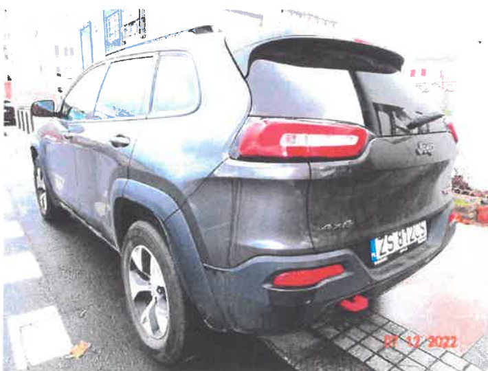
Widok ogólny samochodu