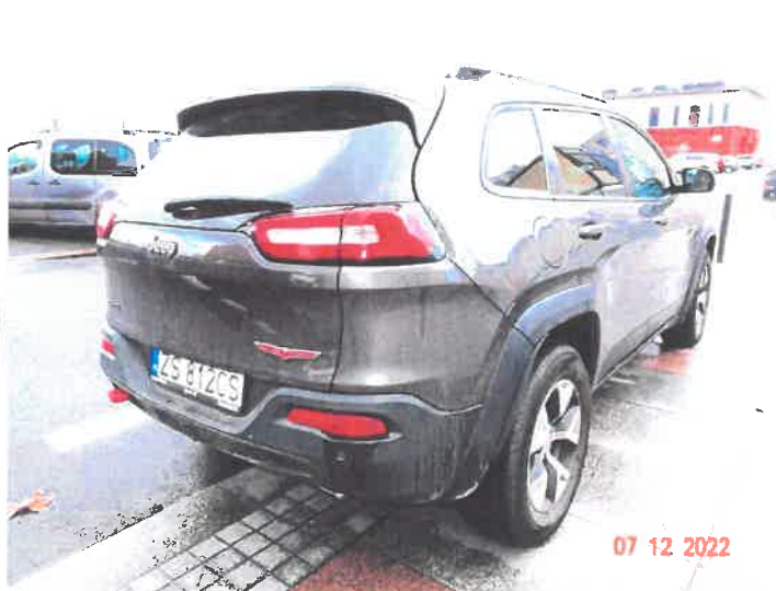
Widok ogólny samochodu