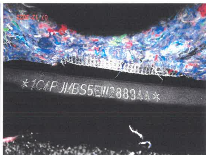
Numer nadwozia VIN