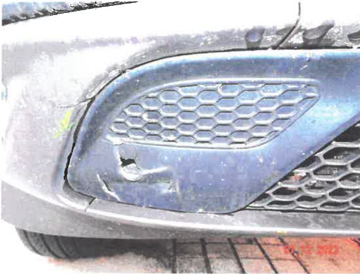
Widoczne uszkodzenia samochodu