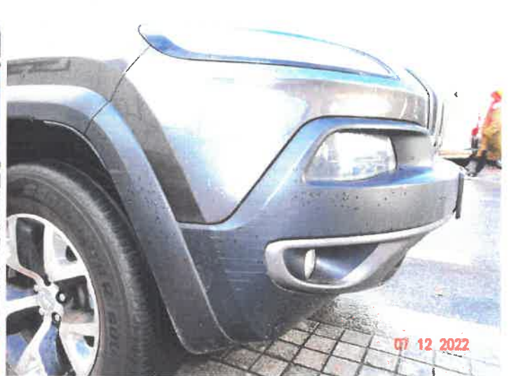
Widoczne uszkodzenia samochodu