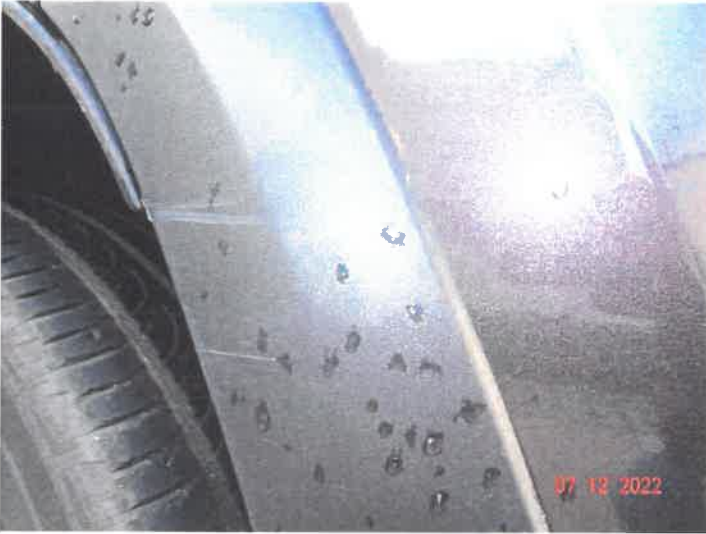
Widoczne uszkodzenia samochodu