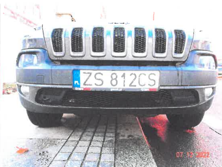
Widoczne uszkodzenia samochodu