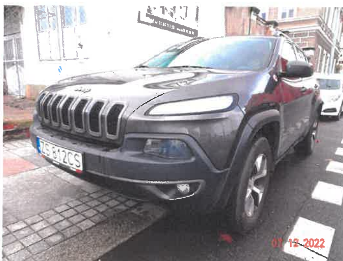
Widok ogólny samochodu