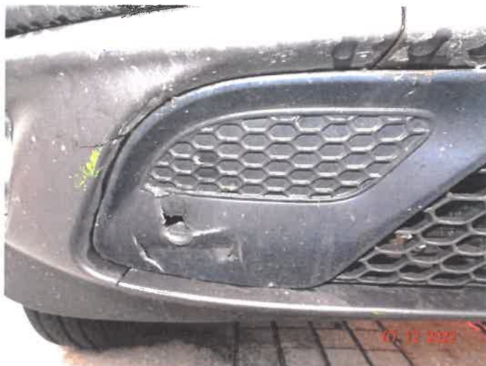
Widoczne uszkodzenia samochodu