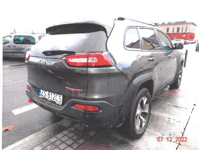
Widok ogólny samochodu