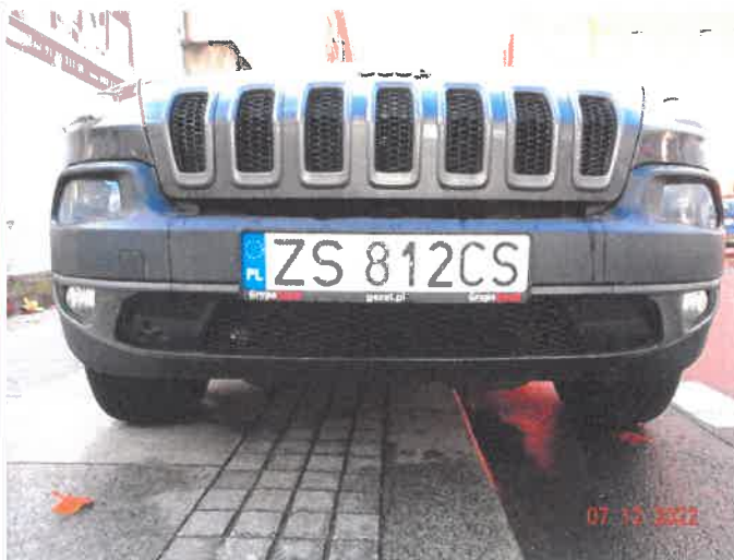
Widoczne uszkodzenia samochodu