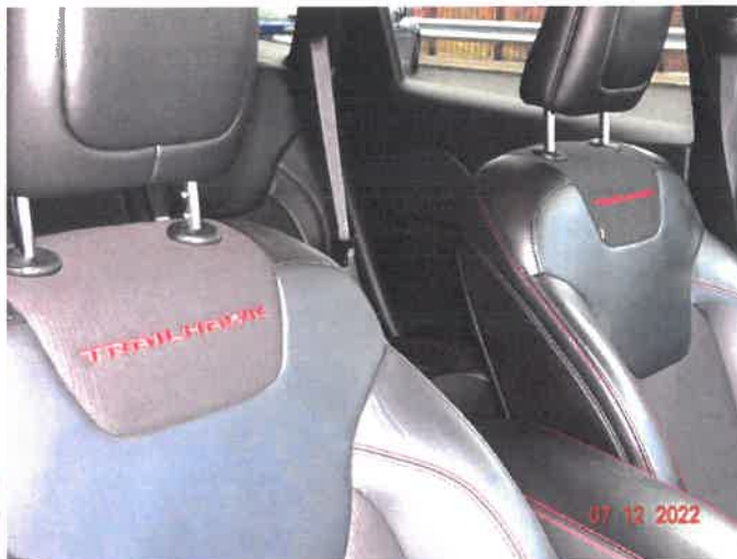
Widok wnętrza samochodu