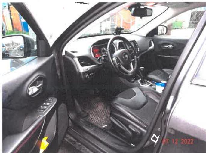
Widok wnętrza samochodu