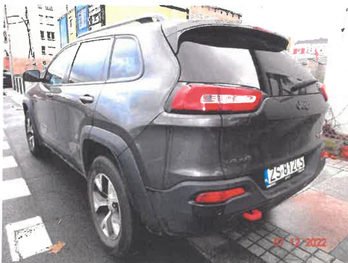
Widok ogólny samochodu