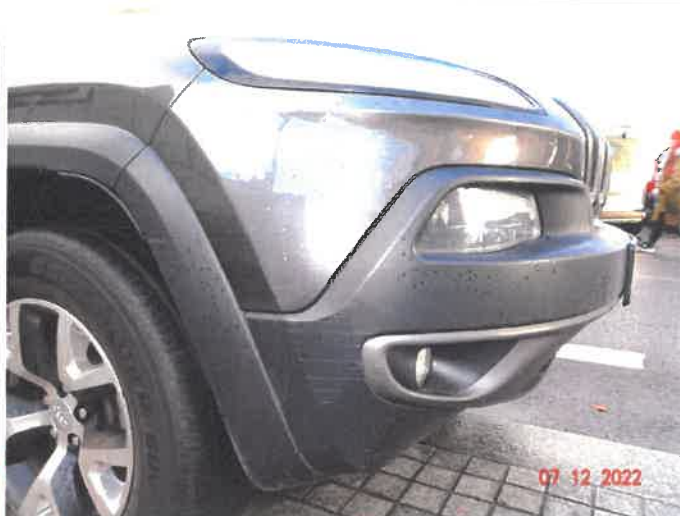
Widoczne uszkodzenia samochodu