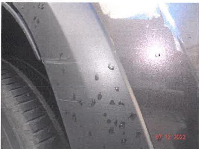
Widoczne uszkodzenia samochodu