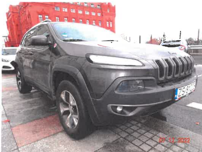
Widok ogólny samochodu