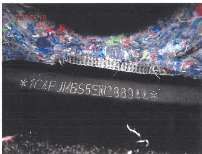
Numer nadwozia VIN