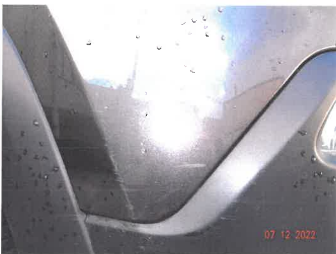
Widoczne uszkodzenia samochodu